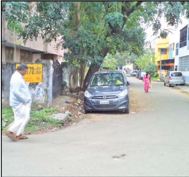
The junction where the incident took place