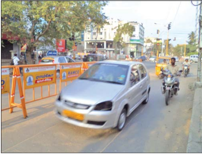
The whole of Burkit Road 2008 after the Usman Road flyover was opened.

A. Maarimuthu (Inspector, Traffic, T. Nagar) told Mambalam Times that this has been done to reduce traffic congestion on streets off Dhandapani Street including Ramanujam Street, Soundarajan Street and Mahalakshmi Street.