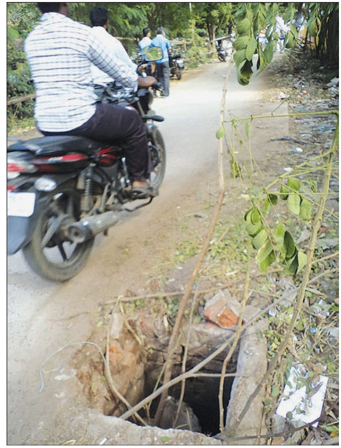
By Our Staff Reporter

An open drain close to the road margin adjacent to Mambalam Railway reservation counter poses a hazard to motorists and pedestrians, especially at night as it is not visible. The counter remains open till 8 p.m.