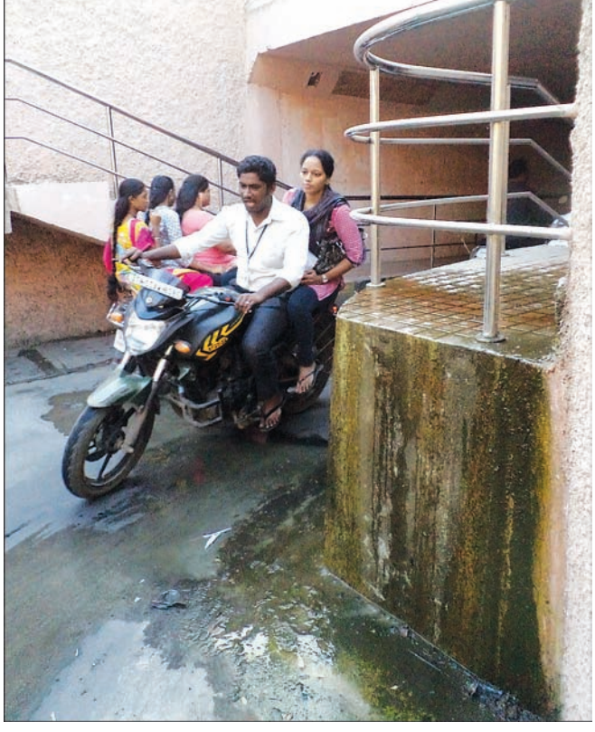
By Our Staff Reporter

Water has been seeping from the side walls of the pedestrian cum 2-wheeler subway connecting Rangarajapuram High Road and Mambalam High Road, T. Nagar, for the past several